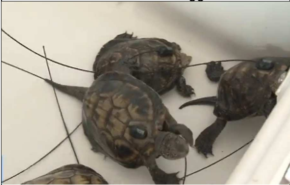
Emys radiomarcate prima della liberazione