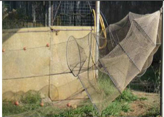
Bertavelli utilizzati per le catture