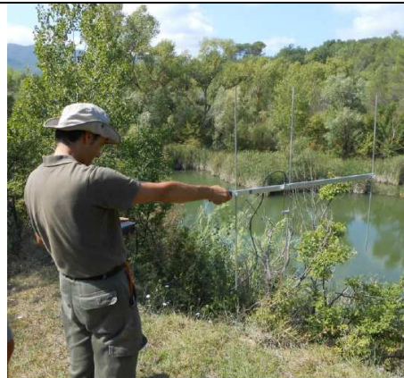
Sessione di radiotracking