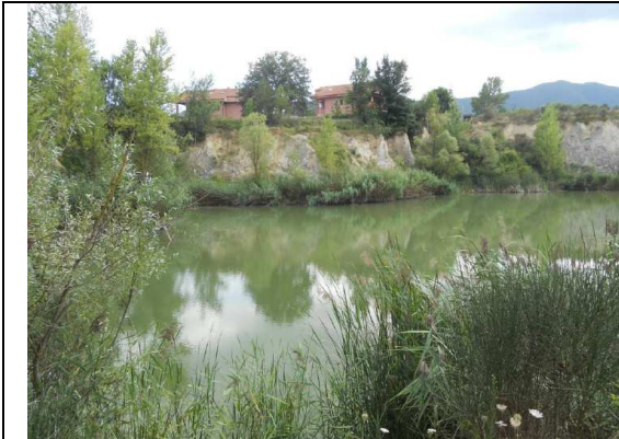
Punto di monitoraggio