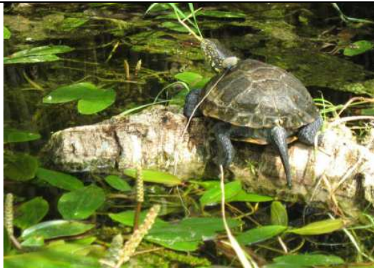
Esemplare radiomarcato in natura