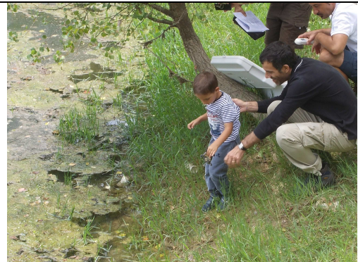
Bimbo che libera una Emys nata al Centro