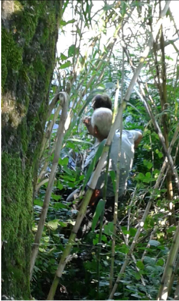
Controllo trappole con l'ausilio dei volontari presso il lago Terenzoni