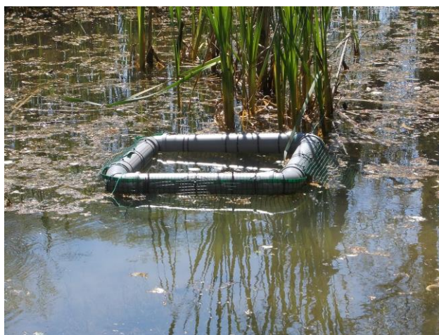
Trappola a bagno di sole utilizzata nei grandi stagni