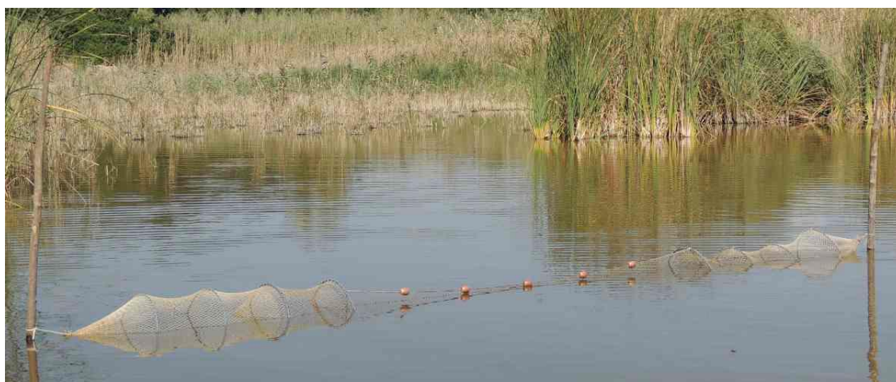
Bartavello senza esca