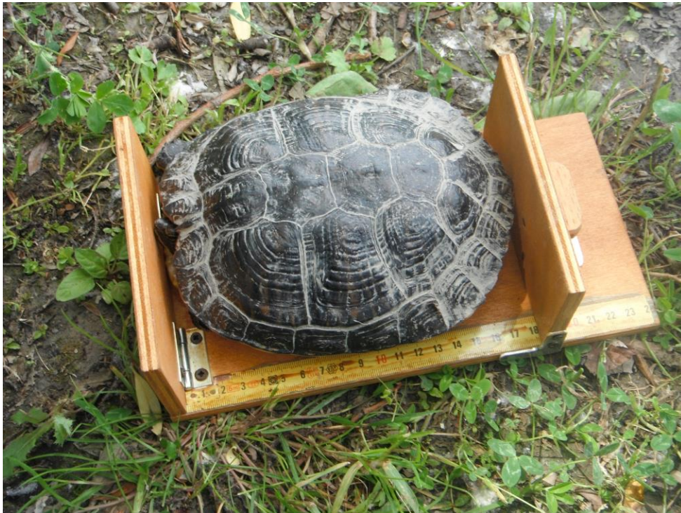
Misurazione di una testuggine catturata