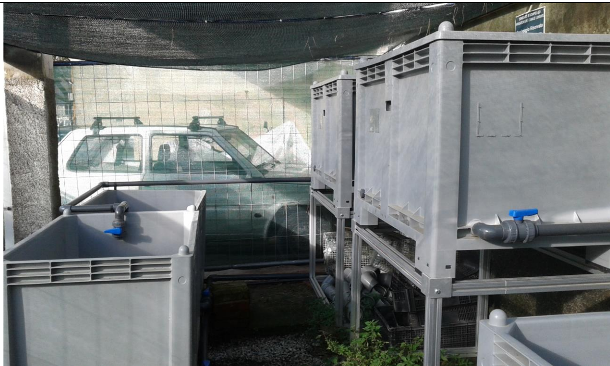
Vasche stabulario Sarzana